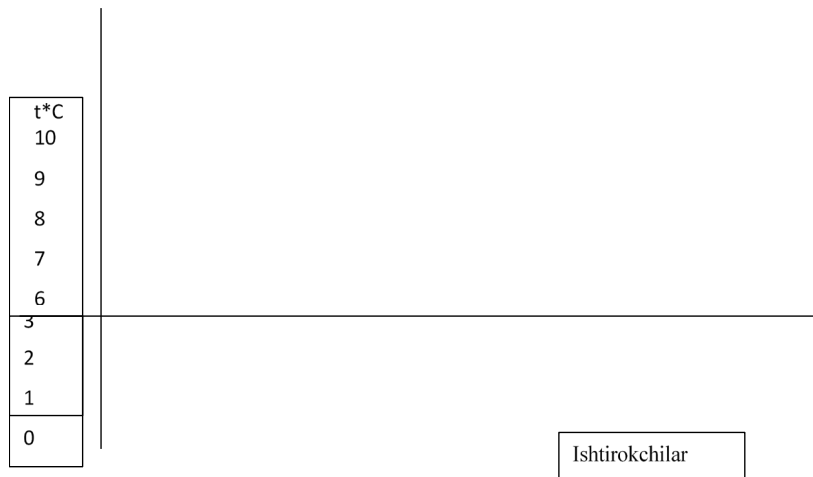
1-rasm. Texnologiyani joriy etish uchun namunaviy jarayon jadvali

Ushbu texnologiyani amalga oshirish uchun zaruriy faoliyat bu "texnologik xarita": Koordinatalar o'qi tasvirlangan katta qog'oz varag'i: vertikal o'q hissiy holatning, ruhiy munosabatning t°C qismidir; gorizonttal o'q ishtirokchilardir.(1-rasm).